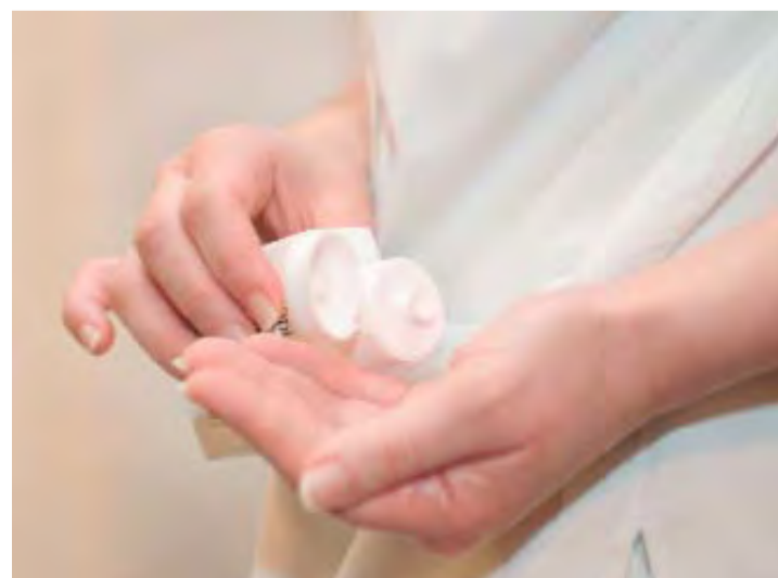
Le geste-clé: la friction au moyen d'une solution hydro-alcoolique.