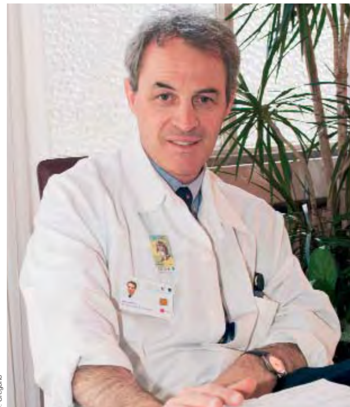
Le Pr Pittet exporte le savoir-faire de son équipe dans le monde entier.

Au plan de l'OMS, le monde est divisé en six régions; dans chacune d'elles des enquêtes seront menées pour attester de la faisabilité et des résultats des actions proposées. Nous allons observer des indicateurs de résultats comme l'évolution des taux d'infections liées aux soins, mais aussi mesurer des indicateurs de structure (disponibilité des recommandations écrites, présence de modules d'édu-