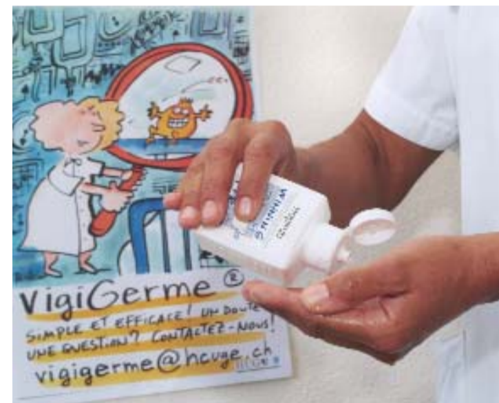
Grâce à Hôpirub®, un soin propre est un soin plus sûr.

Créée par l'Organisation mondiale de la santé, l'Alliance mondiale pour la sécurité des patients lance son premier défi: Un soin propre est un soin plus sûr . Début de la campagne le 13 octobre.