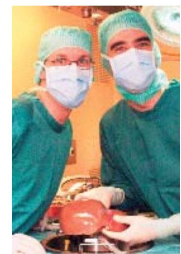
Le don, acte de générosité.

Le 14 octobre a lieu la 1 re journée mondiale pour le don d'organes.