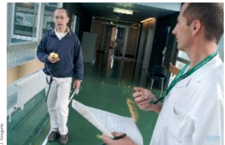
La qualité de vie semble, pour la plupart des patients, en corrélation étroite avec la capacité de marche.

A partir des réponses attribuées, un score global est calculé, 100% étant le niveau de qualité de vie optimal. «L'évaluation longitudinale