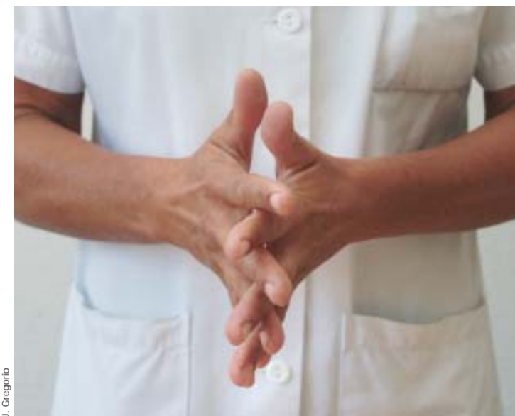
Tout passe par l'hygiène des mains.

Le programme Clean Care is Safer Care comprend cinq volets: la promotion de l'hygiène des mains, l'amélioration de la sécurité liée au prélèvement et à la transfusion de sang, aux injections intraveineuses et aux vaccinations, aux procédures chirurgicales et à l'eau et à l'environnement. Parmi ceux-ci, l'hygiène des mains – travaillant sur le sujet depuis plus de dix ans, les HUG sont devenus une référence internationale en la matière – est érigée au rang de priorité mondiale. «Elle demeure la mesure principale pour réduire les infections car elle est applicable immédiatement partout, ce qui permet un renforcement de la sécurité des patients dans tous les établissements, qu'il s'agisse de systèmes de santé avancés hyper-modernes ou de dispensaires locaux dans des pays en voie de développement», précise le Pr Pittet.